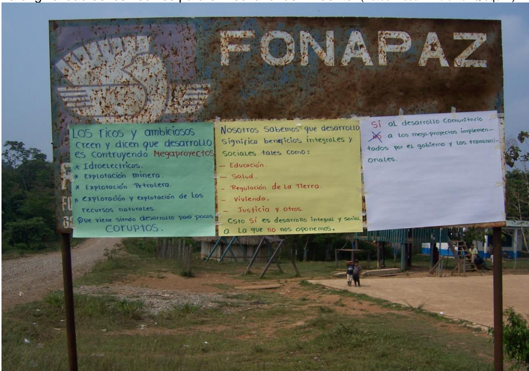
La originalidad de los vecinos para el Rechazo fue Evidente.