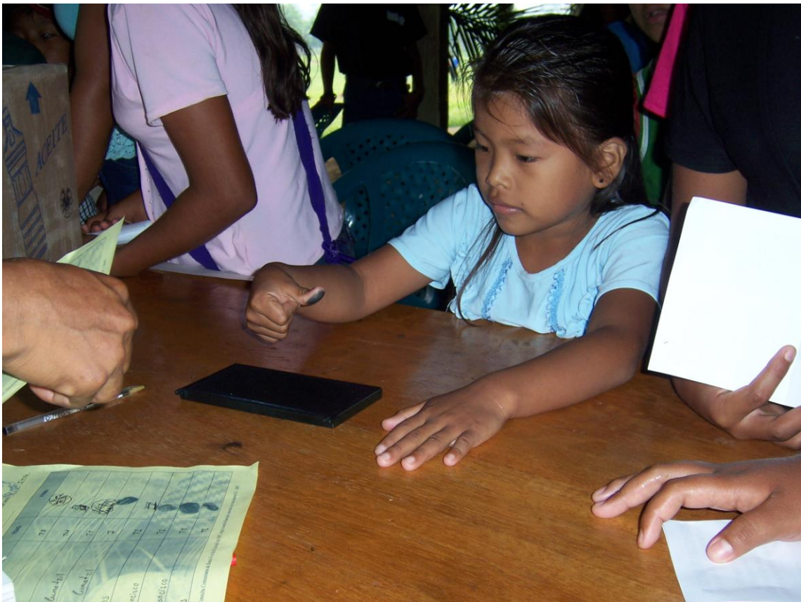
Los Niños del Ixcán También Participaron activamente en la Defensa de sus Recursos Naturales