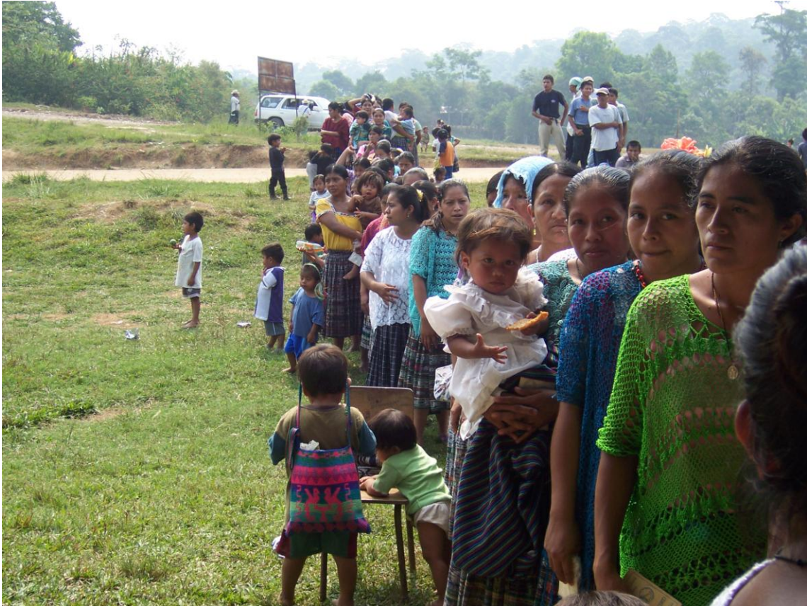
Mujeres Q'eqch'ies con sus Hijos en brazos, en defensa de sus Recursos Naturales