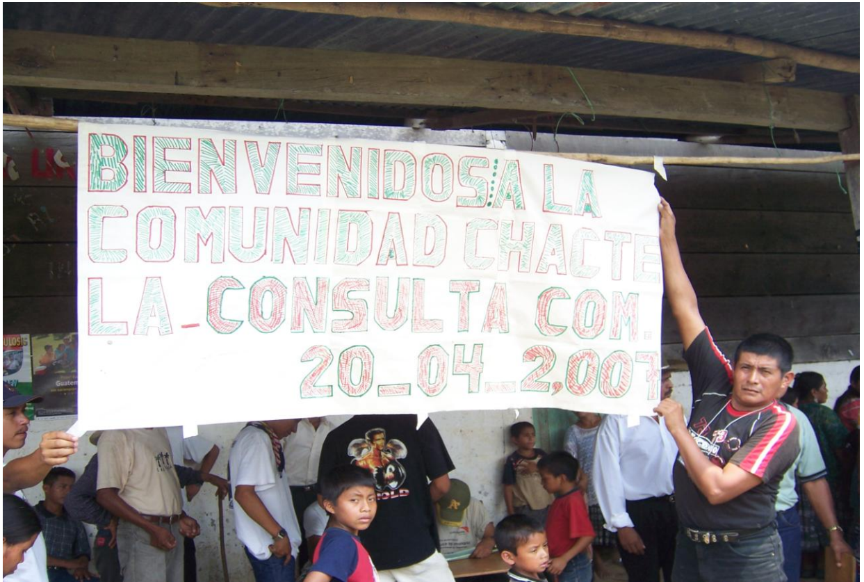
Todos y Todas se hicieron escuchar