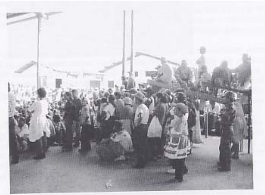
Asamblea general de la ARU

En el ámbito de las exigencias impuestas por el proceso de trabajo se identifican y analizan aquéllas que están directamente vinculadas con el esfuerzo físico que conllevan cada una de las labores o ciclos por actividad, con la monotonía, con las agotadoras jornadas laborales de más de doce horas diarias, como en el caso de los y las adolescentes mayores de 14 años; la ausencia de rotación de actividades, lo cual conduce a la generación de tensiones y presión psicológica debido al cansancio y a una ineficiente organización y división del trabajo.